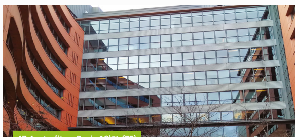
47 Austerlitz - Paris 13 ÈME (75)