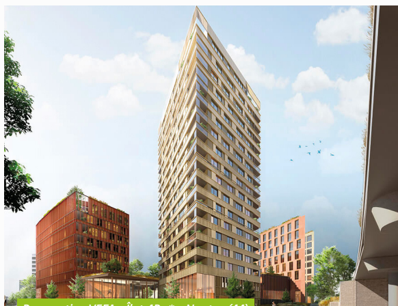
Perspective VEFA «îlot 4B»* - Nantes (44)

Par ailleurs, une cession a été réalisée sur le trimestre, sur une ligne relativement petite de la SCPI, avec l'immeuble Proxima II à Montreuil (93), pour un montant net vendeur de 5,6 M€ (en quote-part).