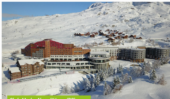
Club Med - Alpe d'Huez (38)

En ce qui concerne la collecte, environ 120 M€ ont été levés par votre SCPI, ce qui représente une hausse très significative par rapport à 2021, et un retour vers les niveaux usuels. C'est un signe de la confiance renouvelée des investisseurs dans les fondamentaux solides du véhicule.